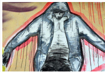
Toute mesure de contention repose sur un consensus d'équipe.

Etymologie : du latin contentio ce qui signifie la lutte, on retrouve par exemple cette même racine latine dans les mots contenir et contentieux.